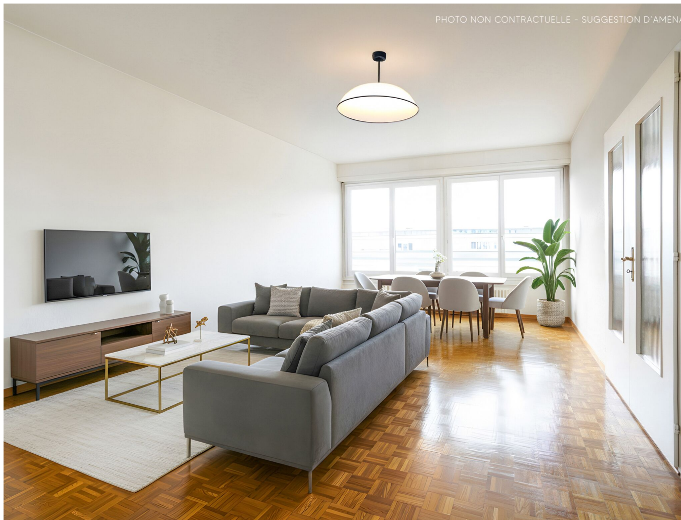
PHOTO NON CONTRACTUELLE - SUGGESTION D'AMENAGEMENT